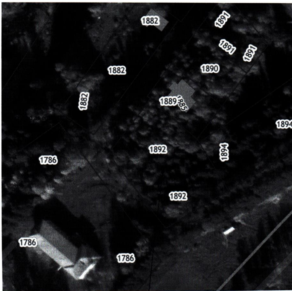
Обследуемый участок с КН 50:26:0110713:1892